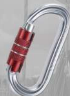
Oval XL 2 Lock Aluminium Mousqueton 2 mouvements EN 12275 / EN 362