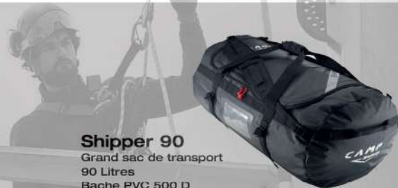
Shipper 90 Grand sac de transport 90 Litres Bache PVC 500 D