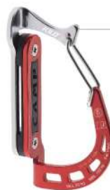
Kilo Mousqueton porte matériel Charge de travail max: 20Kg Résistance: 1.5kN