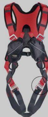
Swift vest Harnais antichute En 361 EN 12841/B