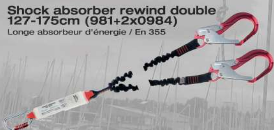
Shock absorber rewind double 127-175cm (981+2x0984) Longe absorbeur d'énergie / En 355