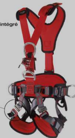
GT Turbo Harnais avec bloqueur ventral intégré EN 358, EN 813