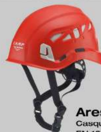
Ares AIR Casque de travaux en hauteur EN 12492 + exigence de performance de la EN 397