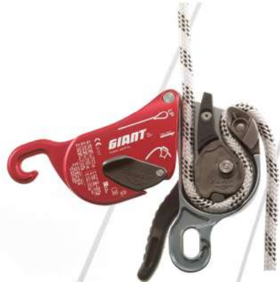
Giant Descendeur multifonctionnel innovant EN 12841 : A/B/C/ EN 341 / 2A EN 15151-1: