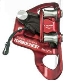
Turbo Chest Bloqueur de poitrine EN 12841/B - EN 567 UIAA