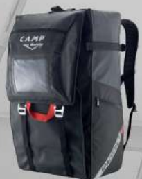
Spacecraft Sac de travail 45 Litres Dimensions: 23x32x62