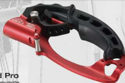
Turbohand Pro Poignée autobloquante EN 12841/B pour des cordes semi-statiques de 10 à 13 mm EN 587 pour des cordes de 8 à 13 mm