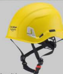
Ares Casque de sécurité EN 397+LD+440 V a.c.+ -20C° +MM EN 50365 / EAC