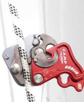
Goblin Dispositif antichute EN 353-2 / EN 12841 / A-B (Vendu avec un mousqueton oval en acier)