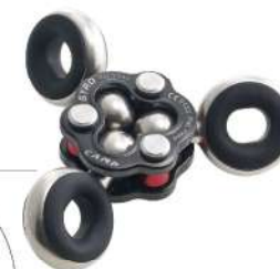
Gyro Dispositif à triple pivot Charge de travail max: 300Kg Résistance: 26kN